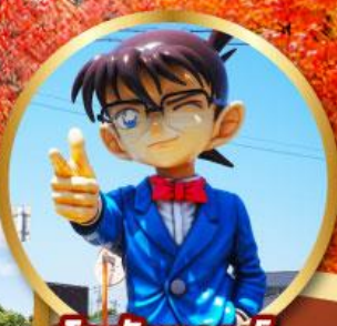
โคนันทาวน์