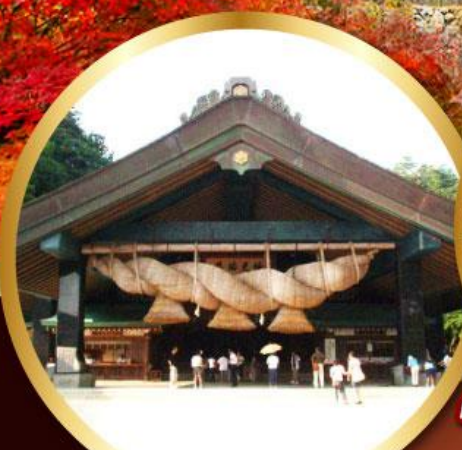
ศาลเจ้าอิชิโมะโกะ